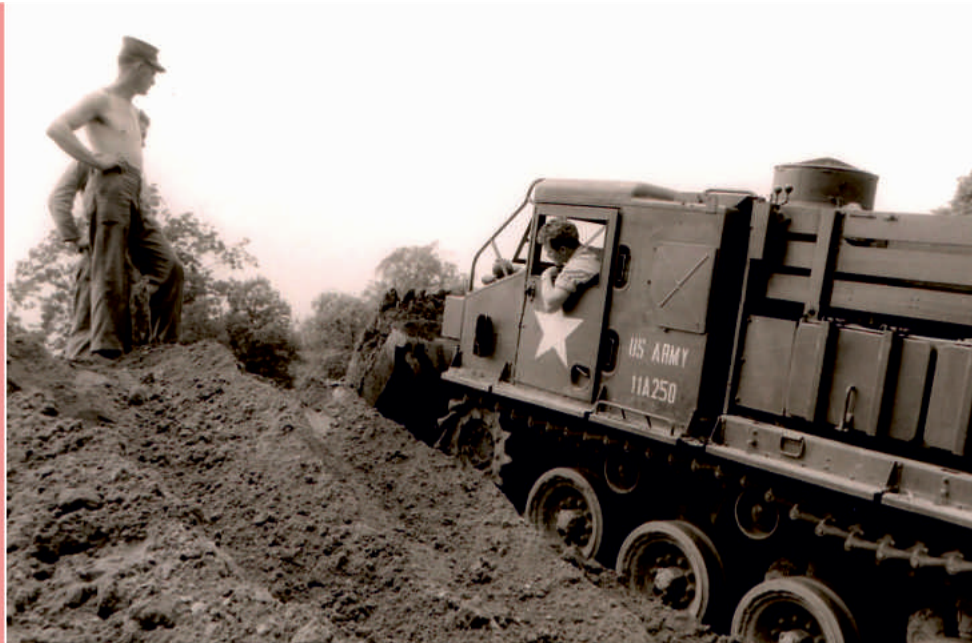
Seit den 1950er Jahren half das US-Depot bei kommunalen Baumaßnahmen in Germersheim regelmäßig aus und verrichtete oftmals Planierarbeiten, wie hier beim Bau der Volksschule im Jahr 1958.