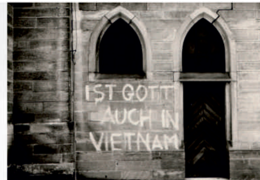
"Ist Gott auch in Vietnam?" – Protest gegen den Vietnamkrieg an der Außenwand der katholischen Kirche in Germersheim