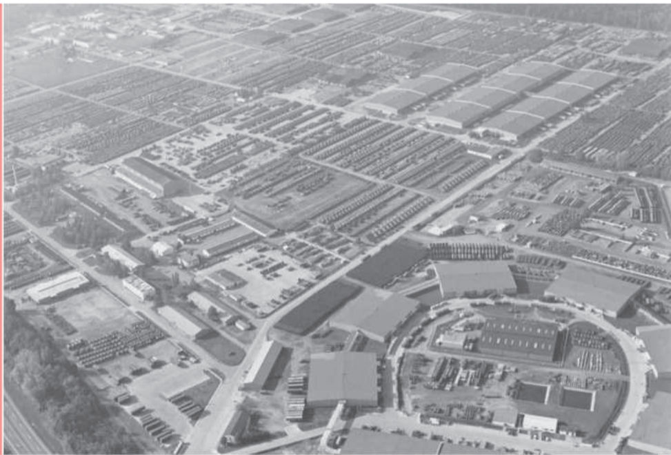
Das Germersheim Army Depot in einer Luftaufnahme aus dem Jahr 1993

Herausgeber: Dipl. Geogr. Michael Geib, docu center ramstein, Verbandsgemeinde Ramstein-Miesenbach 2011 Texte: Ludwig Hans, Stadtarchiv Germersheim Redaktion: Dipl. Geogr. Michael Geib, Dr. Claudia Gross Art Direction: ARTvonROTH.de Druck: printec-media Besonderer Dank an: Ludwig Hans, Stadtarchiv Germersheim; Stadt- und Festungsmuseum Germersheim