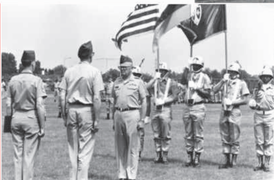
Kommandowechsel im Germersheim Army Depot im Jahr 1974: In der Bildmitte Colonel Kenneth S. Whittemore vor dem angetretenen Flaggenkommando