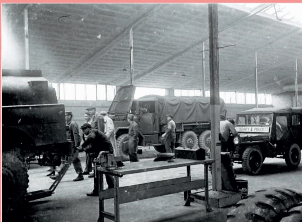
Bereits in den frühen 1950er Jahren war das US-Depot ein wichtiger Arbeitgeber für Germersheim und Umgebung: Blick in den "MIS"-Shop ("Maintenance in Storage") im Jahr 1953.

Nicht nur Amerikanern, sondern auch deutschen Gästen stand der seit 1962 betriebene "NCO-Club International" am Rande des Depotgeländes, in unmittelbarer Nähe von Tor 1 offen. Dort gab es u. a. auch ein kleines Restaurant, wo man sich, lange bevor US-Fastfoodketten ihre Filialen in Deutschland eröffneten, an Hamburgern sättigen konnte. Es gab sie in zwei Varianten: "plain" und "de Luxe", ohne oder mit amerikanischen "French Fries" (Pommes Frites). Ein einfaches aber preiswertes Vergnügen, das auch dem schmalen Budget des Verfassers dieses Beitrags in seiner Zeit als Germersheimer Oberstufenschüler Mitte der 1970er Jahre durchaus gerecht wurde. Auch durfte er erste Erfahrungen mit "Root Beer" machen, einem mit viel Eis servierten Erfrischungsgetränk und einem für deutsche Verhältnisse ausgesprochen exotischen Geschmack.