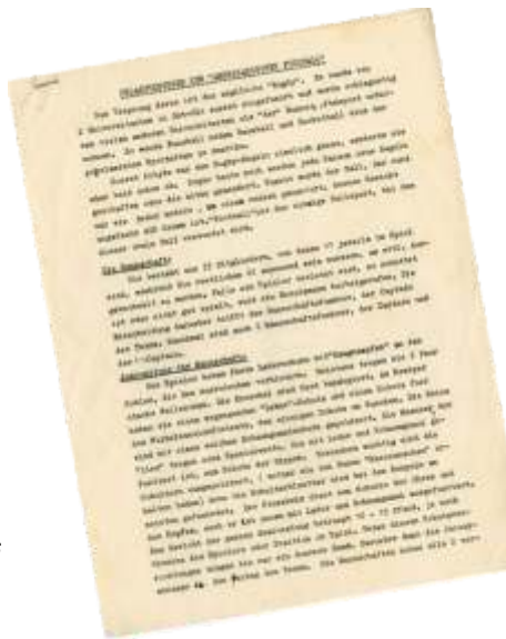
Program for the game of the 86 th Raiders against the Erding Arrowheads, 1953

Fun Fact: Since the German guests were unfamiliar with the rules and character of the game at that time, they were given explanations for a better understanding of the sport.