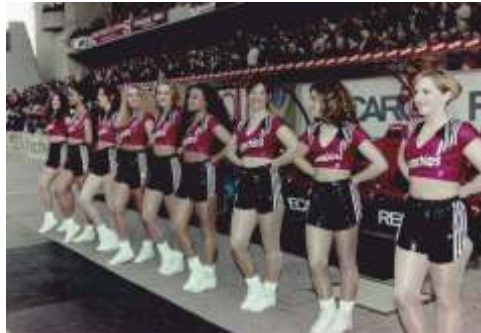
Cheerleaders des 1. FCK: die Crunchchip Girls